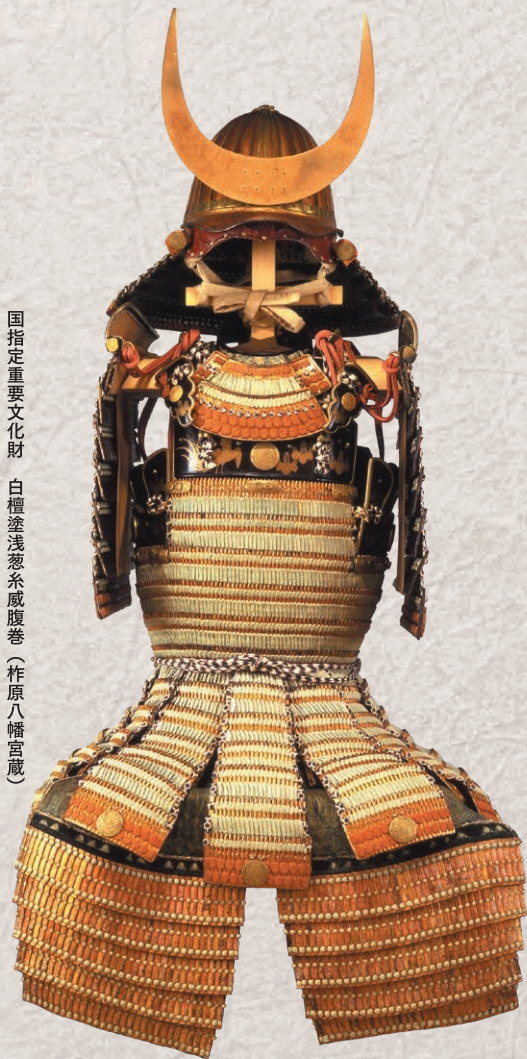
国指定重要文化財 白檀塗浅葱糸威腹巻(杵原八幡宮蔵)