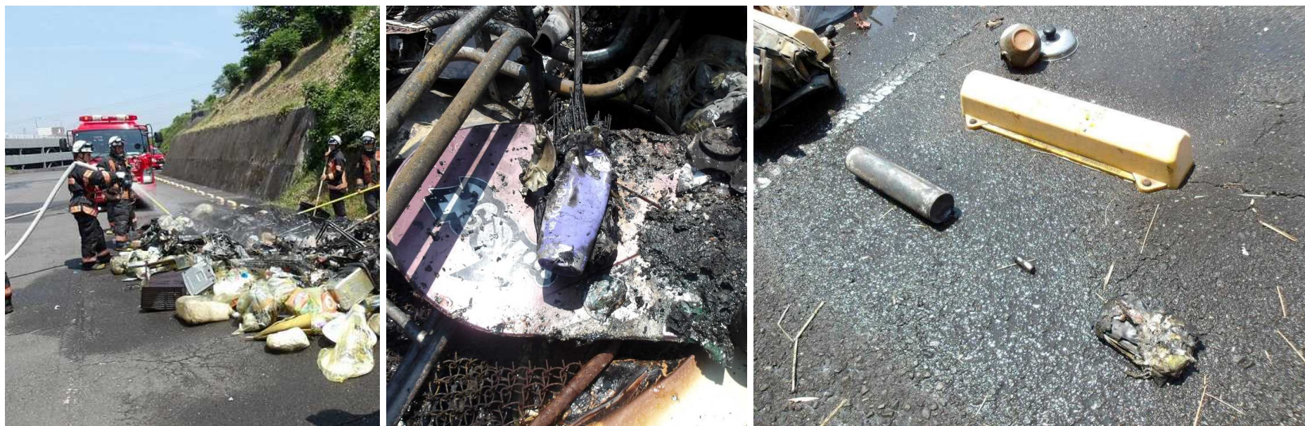
車両火災の様子(2025年5月14日車両火災)

今回は火元の特定に至っていませんが、過去には電池やガス缶による火災が発生していることから、重大事故を未然に防ぐため、ルールを守ってごみを出してください。