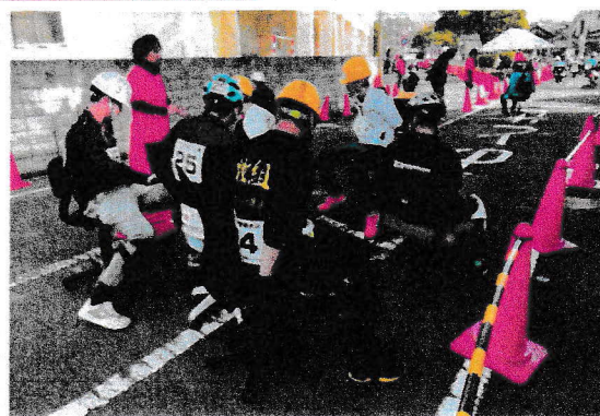
いすー1グランプリ大分鶴崎大会

2010年、京都府内の商店街で地域活性化の一環として始められ、3年前に熊本県内で開かれた大会に初出場した際、会場の盛り上がり素晴らしかったことから、地元で開催することで鶴崎の街を全国の人に知ってもらい、地域活性化、地域交流につなげていきたいとの思いから誘致し、県内では初めて開催する。