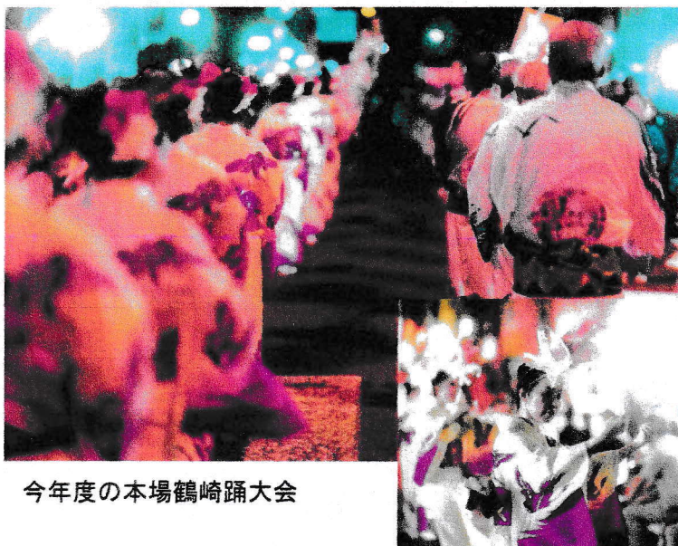
今年度の本場鶴崎踊大会