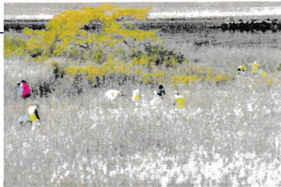
乙津川河口付近干潟の清掃活動